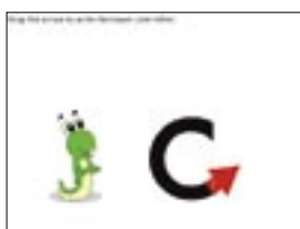
Form the Letter